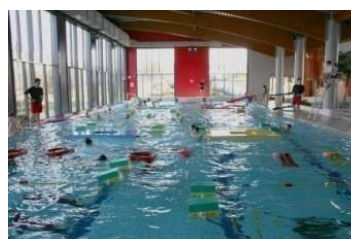
Centre aqualudique Balnéor