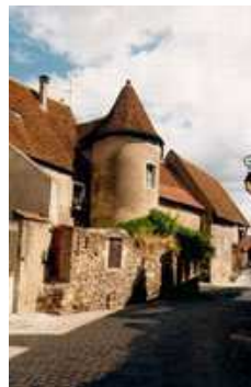
La ville historique

Ouvert de 10h à 12h et de 14h à 17h tous les jours, Tarifs : 6 € / adulte, 4 € / enfant (4-12 ans), 18 € / famille, Exposition temporaire : 3 € www.cite-or.com