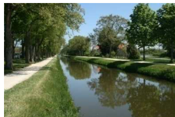
Canal de Berry