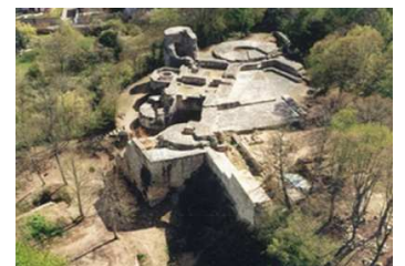
La Forteresse de Montrond