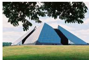
La Cité de l'Or