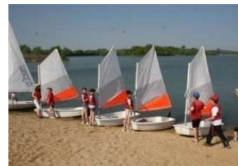
Activités nautiques au lac de Virlay

Balnéor, est un centre aqualudique dans un environnement d'exception, un lieu de détente et de loisirs particulièrement apprécié. Un espace soins du corps indépendant de la structure loisirs propose hammam, sauna, solarium, espaces de cardiotraining... http://www.vert-marine.com