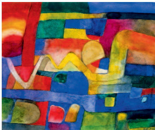
Estève. Aquarelle "A.1071", 1972

Retrouvez les collections des musées sur la base "joconde" http://www.culture.gouv.fr/documentation/joconde/fr/pres.htm